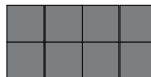
W200 200X100 cm