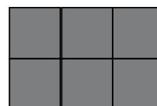
W150 150X100 cm