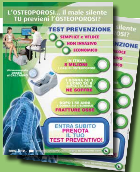
NR.02 POSTER VETRINA 50X70