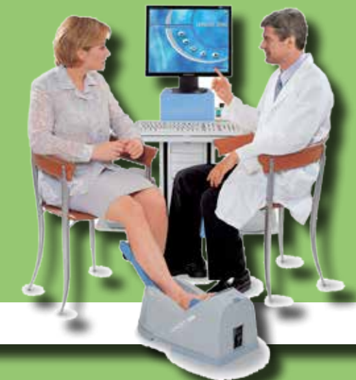
NR.01 TECNICO OPERATORE M.O.C.