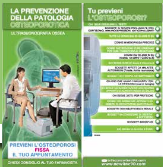
NR.200 FLYER INFORMATIVI