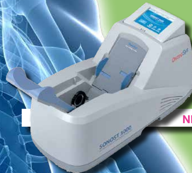
NR.01 STRUMENTO AD ULTRASUONI